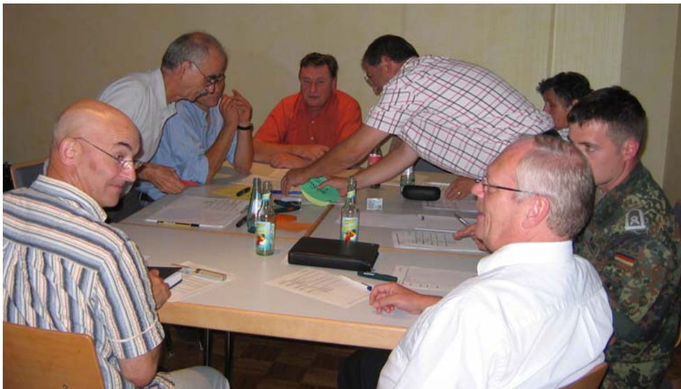
Die Arbeitsgruppe „Bauen und Wohnen“ des 1. Workshops bei Auswertung und Erörterung der Ergebnisse eines Fragebogens zur Stadtentwicklung

Dazu soll das Thema Demografischer Wandel mit seinen vielfältigen Auswirkungen auf die Lebensbedingungen in die politische Diskussion gebracht werden. Durch einen Prozess öffentlicher Erörterungen der künftigen Entwicklung soll diese auf die Erfordernisse veränderter Rahmenbedingungen einer schrumpfenden und älter werdenden Bevölkerung ausgerichtet werden. Im Rahmen dieser Erörterungen sind geeignete Strategien für die Entwicklung der Siedlungsstruktur und den Erhalt des Ortsbildes zu erörtern. Es sind auf spezifische örtliche Bedingungen zugeschnittene bauliche und wirtschaftliche Lösungen aufzuzeigen.