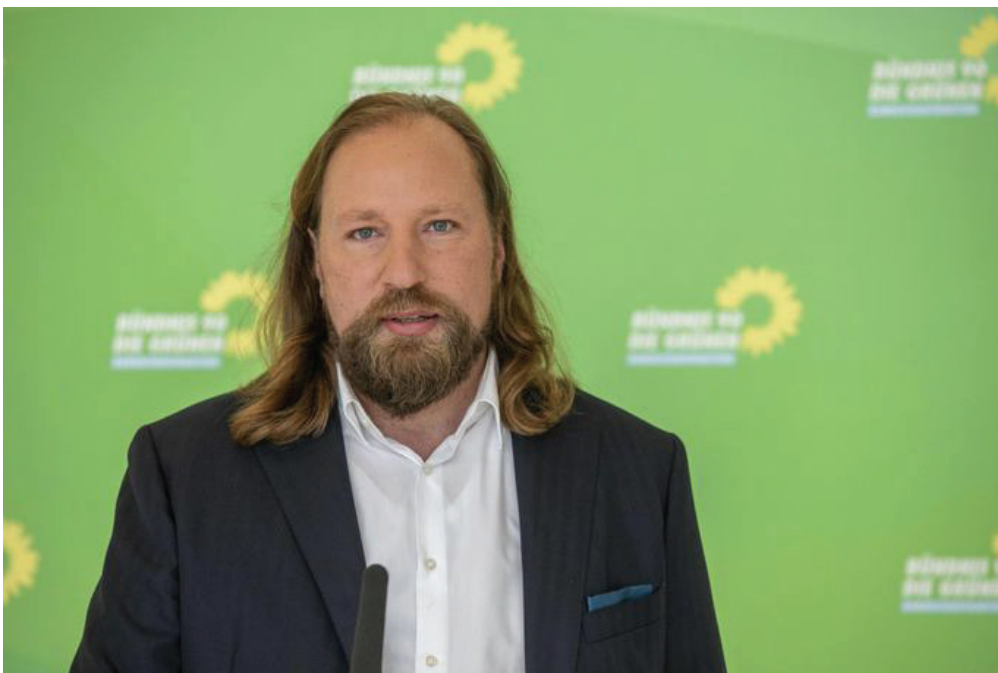
Saksamaa roheliste erakonna parlamendifraktsiooni juht Anton Hofreiter peab ühepereelamuid süüdlaseks valginnastumises. See väljaütlemine ajakirjale Der Spiegel tekitas paljudes sakslastes hirmu, et rohelised tahavad uute eramute ehitamise riigis täielikult keelata.

See tekitab palju meelehärmi riigis, kus praegu kerkib igal aastal üle 100 000 uue eramu ja oma majas elamist eelistab 60 protsenti elanikkonnast. Eramute tulevikku puudutav läheb korda niivõrd paljudele, et sellekohane arutelu saab ennustuste järgi keskseks sügisestel Saksamaa parlamendivalimistel.