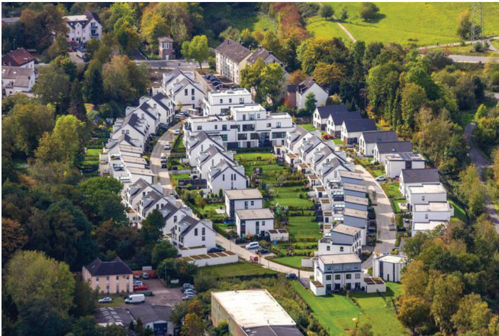
Uuselamurajoon Bochumi äärelinnas. Paljud Saksamaa suurlinnad seisava silmitsi elupindade ja vaba maa nappusega, mistõttu nähakse ühe lahendusena uute ühepereelamute ehitamise piiramist ja nende asemele kortermajade rajamist.