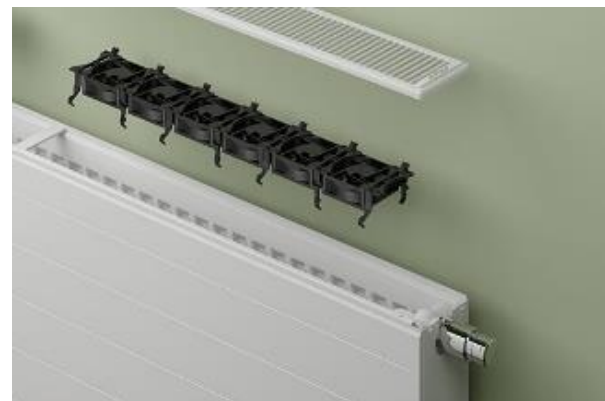
Bildquelle: Kermi GmbH (x-flair)

Wandheizelemente können zusätzlich oder alternativ in die Heizkreise integriert werden. Mit Decken- und Sockelleistenheizungen können niedrige Vorlauftemperaturen erreicht werden.