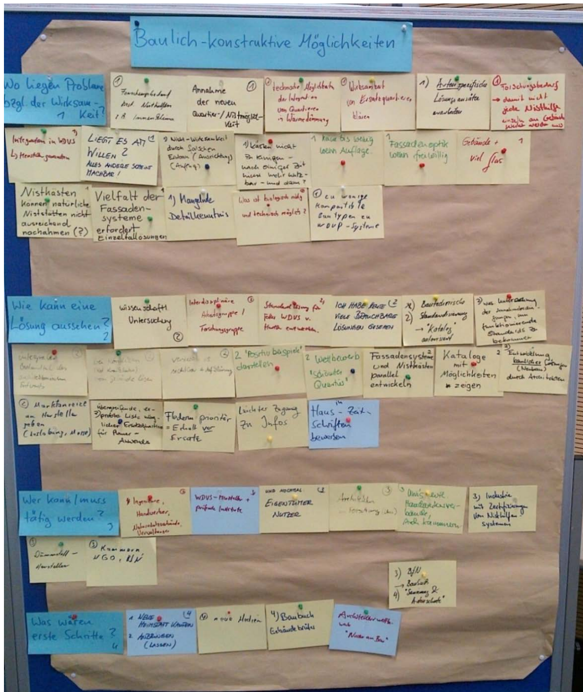
Abbildung 3: Ideensammlung zum Themenblock „Anwendung baulich-konstruktiver Möglichkeiten“

den, sollte nicht ausschließlich von einer hohen Eigenmotivation der Hausbesitzerinnen abhängen, sondern standardisiert angeboten werden. Denkbare „Bastellösungen“ führen nach Meinung der Teilnehmerinnen nicht weiter. Vielmehr sollten fertige Einbausysteme mit Herstellergarantie bezüglich des Einbaus in WDVS forciert werden.