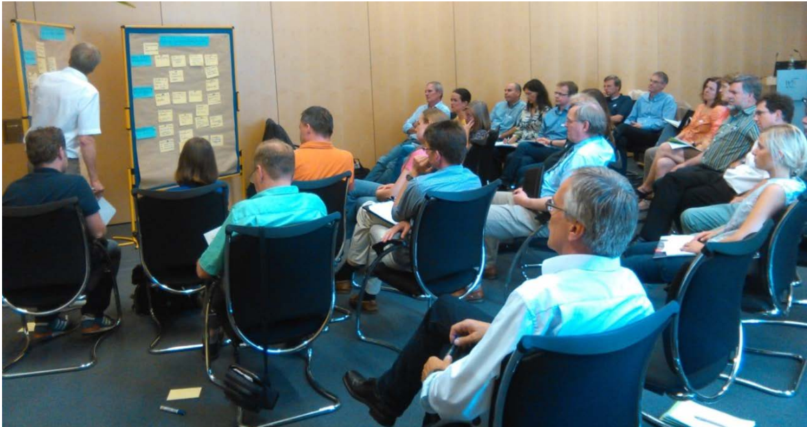
Abbildung 1: Ideensammlung und Diskussion im zweiten Teil des Fachgesprächs

Im Rahmen der moderierten Diskussion wurden zwei Fragenkomplexe erörtert. Dabei ging es einerseits um die Verbesserung der Wirksamkeit rechtlicher und baulich-konstruktiver Maßnahmen (vgl. Kapitel 2.2.1). Der zweite Fragenkomplex beschäftigte sich mit den Möglichkeiten einer gezielten Förderung gebäudebewohnender Arten sowohl durch Aufnahme in bestehende oder neue Förderprogramme als auch durch Bewusstseinsbildung und Motivation, etwa durch Maßnahmen der Öffentlichkeitsarbeit (vgl. Kapitel 2.2.2).