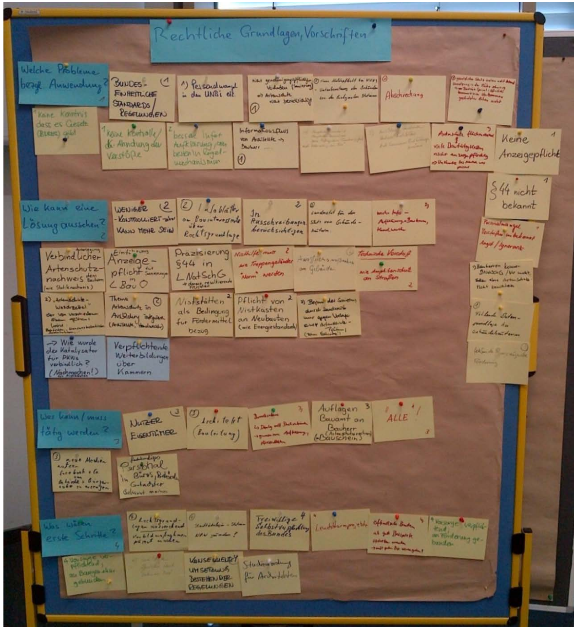
Abbildung 2: Ideensammlung zum Themenblock „Rechtliche Grundlagen und Vorschriften“

Infoblätter für Bauherrinnen, die über Rechtsgrundlagen und bauliche Möglichkeiten informieren, müssten bei den Bauämtern bereitliegen. In diesem Zusammenhang wurde die Aufnahme des gebäudebezogenen Artenschutzes in technische Vorschriften, ähnlich dem Merkblatt Amphibien-schutz an Straßen (MAMs), vorgeschlagen.