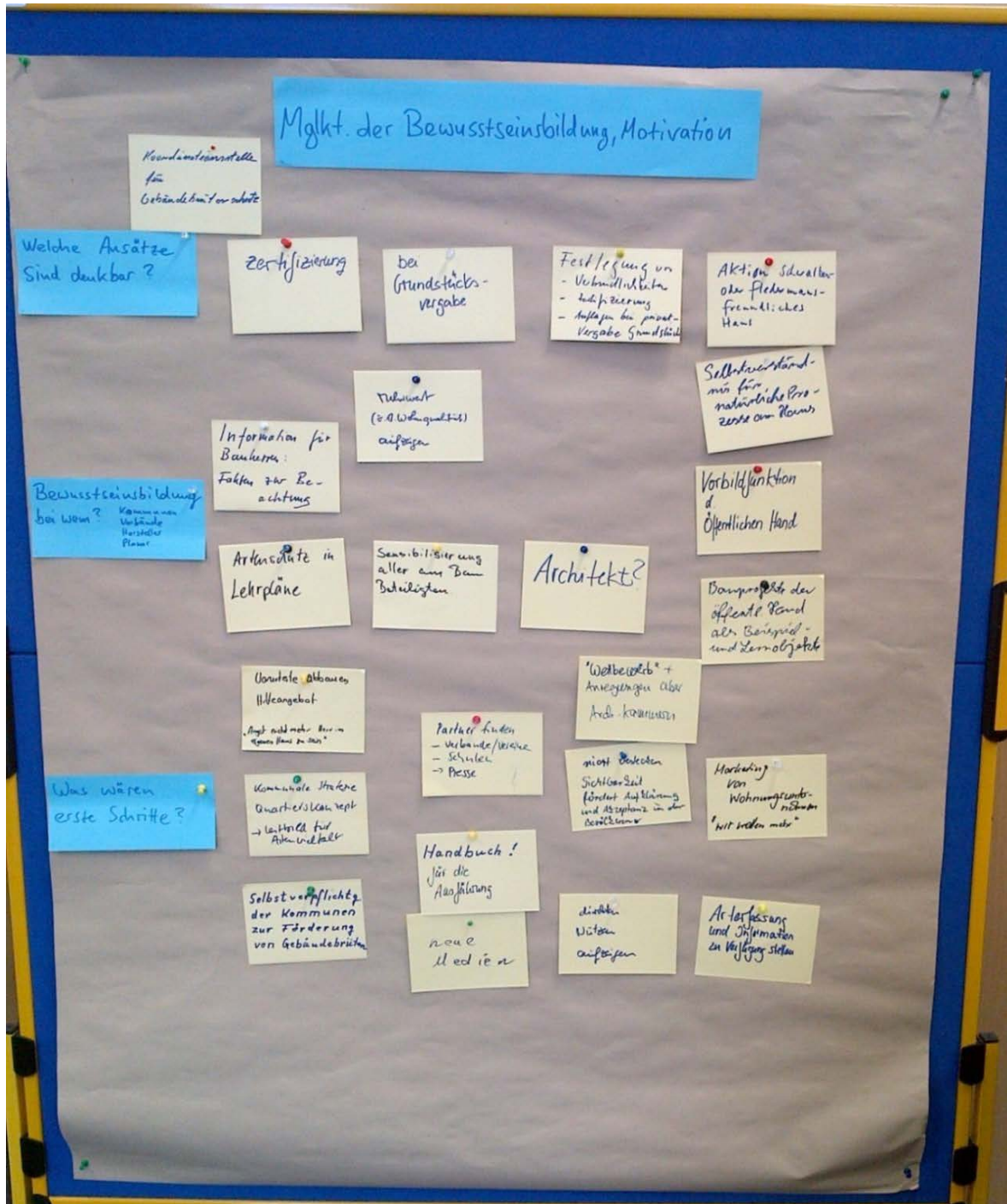
Abbildung 5: Ideensammlung zum Themenblock „Möglichkeiten der Bewusstseinsbildung und Sensibilisierung“

Vielfach existiert der Irrglaube, dass ein offensiver Umgang mit gebäudebewohnenden Arten zu (wirtschaftlichen) Lasten der Hauseigentümerinnen bzw. der Bauherrinnen gehen kann. Hierzu sind Angebote und Maßnahmen zu entwickeln, die dazu beitragen, Befürchtungen, insbesondere in Bezug auf die Verletzung artenschutzrechtlicher Konsequenzen abzubauen. Auf kommunaler Ebene erscheint es sinnvoll Maßnahmen des Artenschutzes an Gebäuden in politische Strategien und Quartierskonzepte zu integrieren und dies als neue Qualität an die Bevölkerung zu kommunizieren.